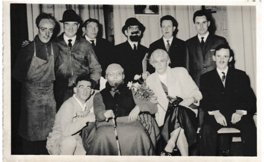
De ontspanningsgroep "de vrolijke tisten"

Er werd afgesloten met opnieuw een gebed en toch ook met "een klein glaasje met iets goeds erin".